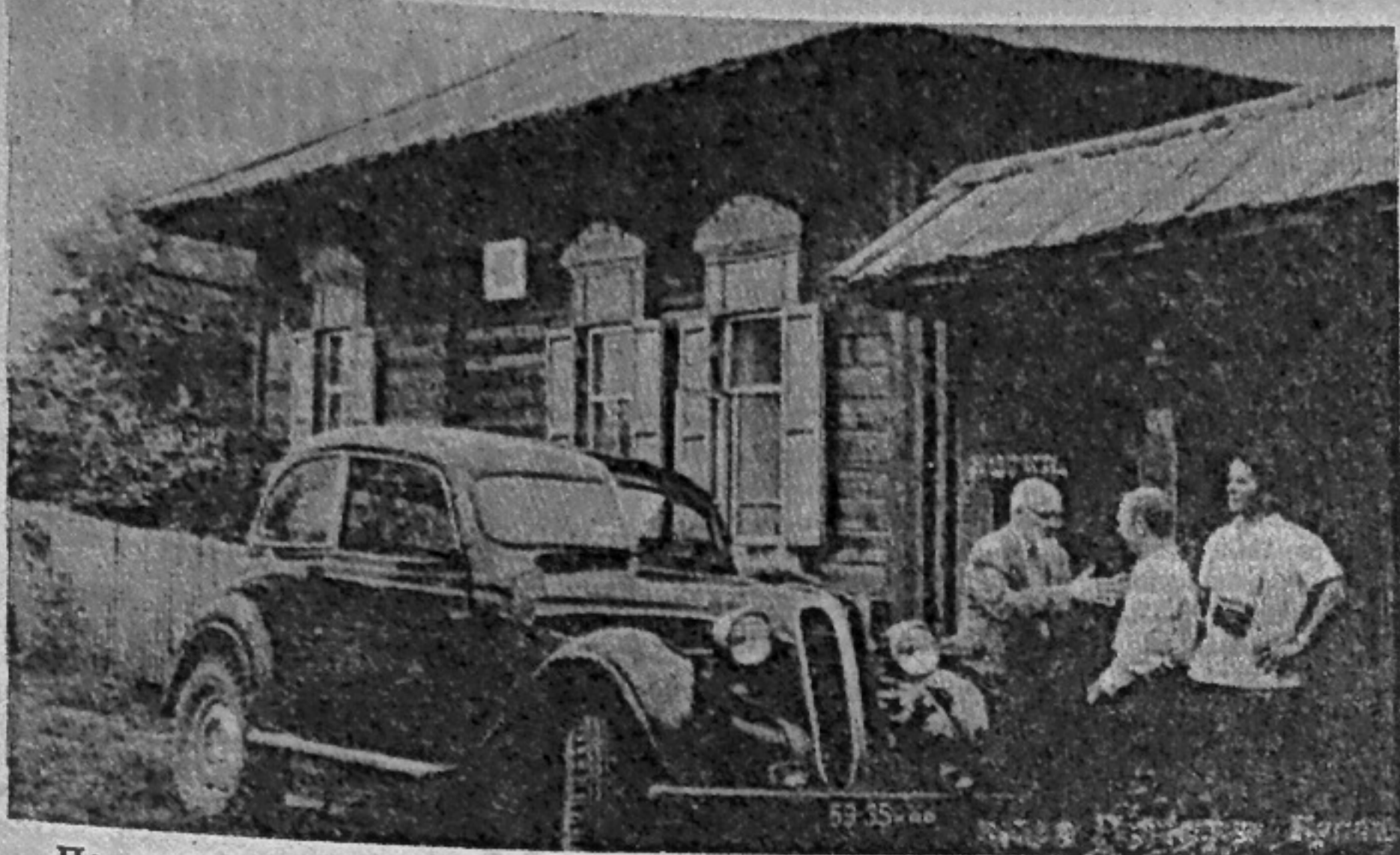
По ленинским местам. Село Ермаковское. В этом доме слышались голоса Ленина, Вансеева, Лепешинского... всех 17-ти ссыльных, подписавших известный «Протест российских социал-демократов».