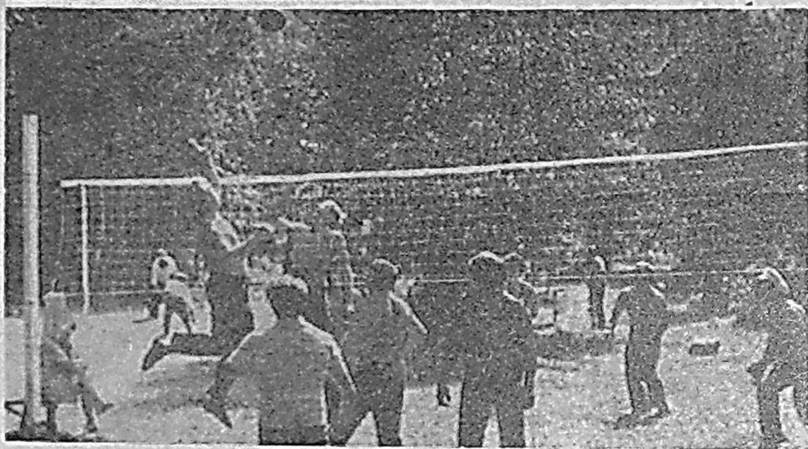
СаАЗовцы в минуты отдыха.