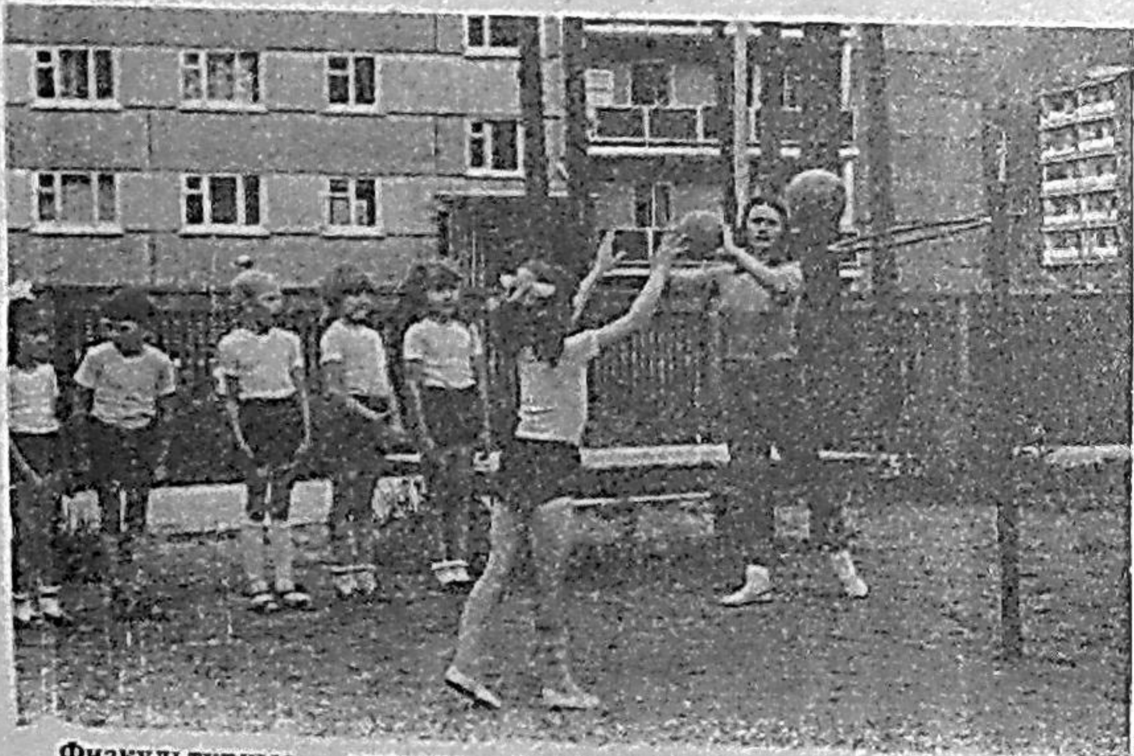
Физкультурные занятия в подготовительной группе детского сада.