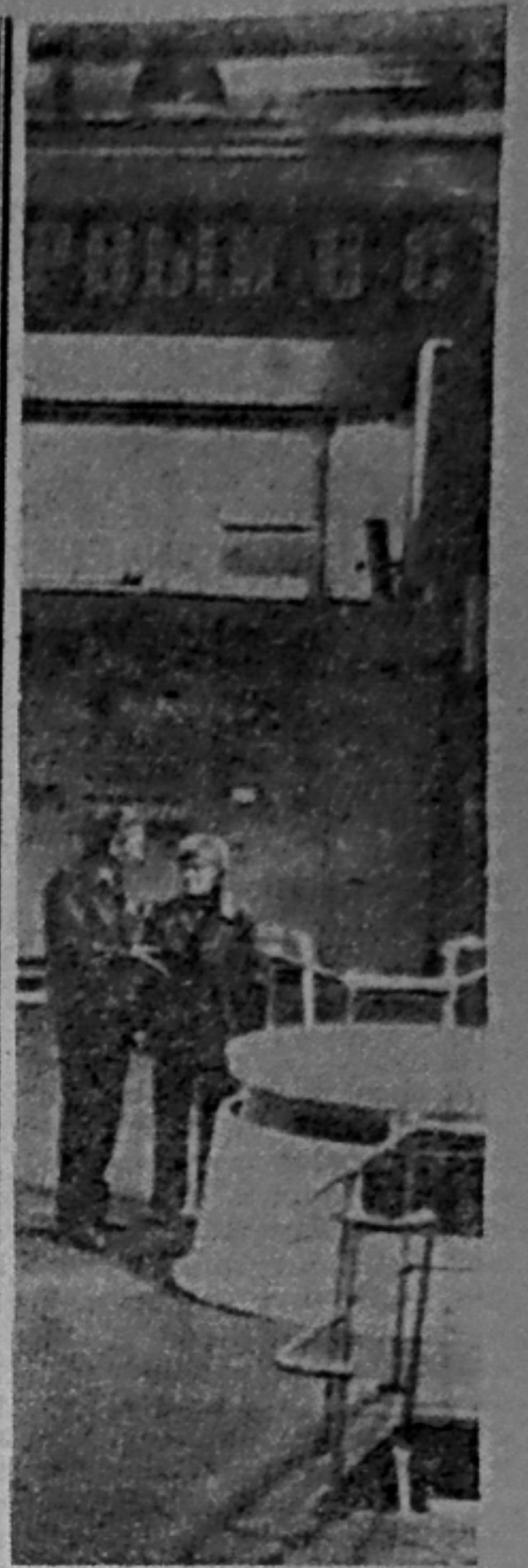
Саяно-Шушенская ГЭС: в машинном зале здания гидроэлектростанции.