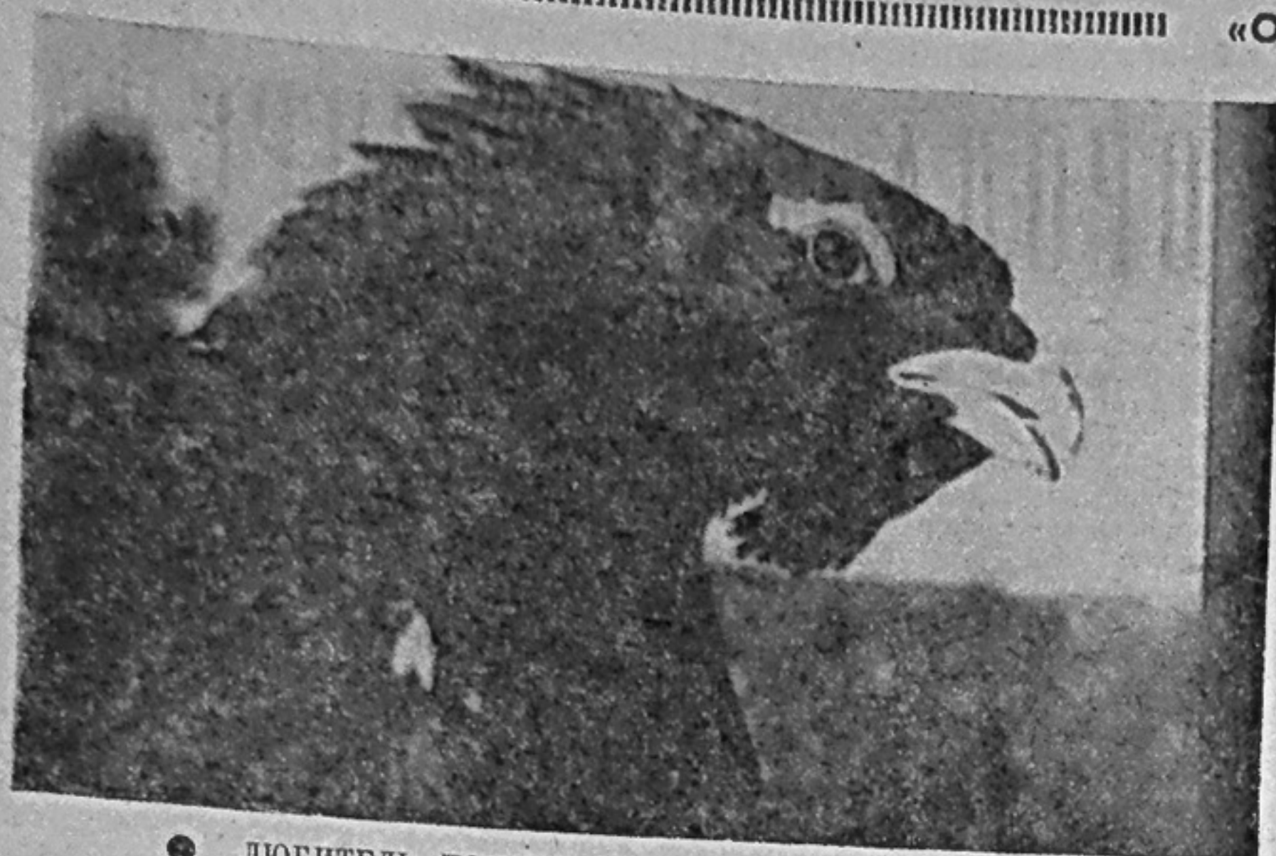
● ЛЮБИТЕЛЬ ПОЗИРОВАТЬ