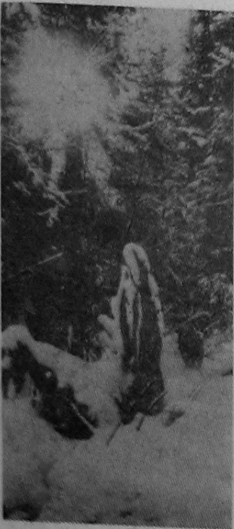
Зимний пейзаж.

А. АНТОНЕНКО, заведующая ручным отделом Майнской аптеки.