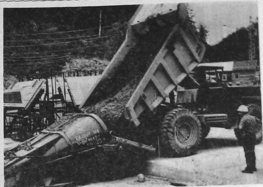
На полигоне строительства ведутся большие работы по испытанию высокопроизводительных механизмов для широкого использования их на укладке бетона и других операциях. Многие из них уже внедрены в практику, другие проходят опробование, усовершенствование. Начата укладка бетона в плотину при помощи крана КБГС-1000. На полигоне испытывались бады емкостью 8 кубометров, бетоновозы на базе БелАЗ-540, здесь проводились необходимые конструктивные изменения. На снимке: на испытательном полигоне во время отработки процесса выгрузки бетона в бады большой емкости.

Основная работа участка направлена на полную механизацию кровельных работ. До этого укладка мягкой кровли была только частично механизирована — подача битумных мастик на высоту Коллектив участка работает над тем, чтобы и разлив мастики, и укладку ее на кровле, и раскатку полностью механизировать. На участках МКД отработаны и внедрены нормокомплекты — новая форма обслуживания подразделений, которой принадлежит будущее. Необходимые для определенного вида работ механизмы закрепляются за организацией без ежемесячной заявки. Обновляются — при необходимости.