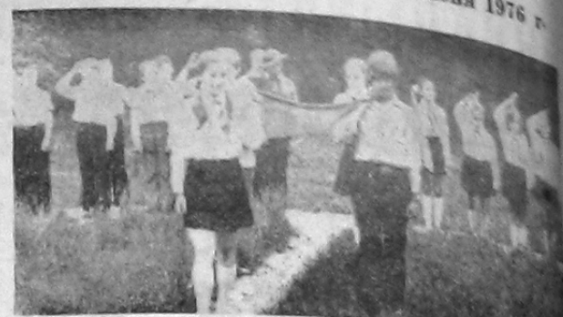
В ПИОНЕРСКОМ ЛАГЕРЕ «СОКОЛ»

Действенное политическое и экономическое образование коммунистов и всех трудящихся поможет саяногорцам успешно взять в труде высокие рубежи десятилетия.