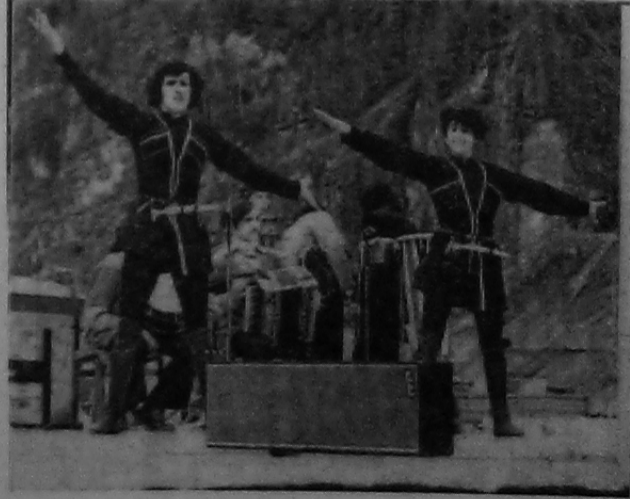
На снимках: встреча на саянской земле. Концерт для гидростроителей.