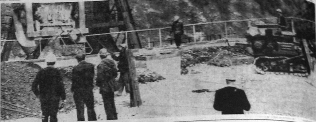
НА ОПЫТНОМ ПОЛИГОНЕ СТРОИТЕЛЬСТВА САЯНО-ШУШЕНСКОП ГЭС ИДЕТ СЕЙЧАС СБОРКА ОПАЛУБКИ НОВОЙ КОНСТРУКЦИИ ДЛЯ ПРИМЕНЕНИЯ НА ВОДОСЛИВНОЙ ГРАНИ ПЛОТНЫИ.

На семинаре была сделана информация о состоянии гласности — необходимом условии эффективности работы групп и постов. Состоялся обмен мнениями.