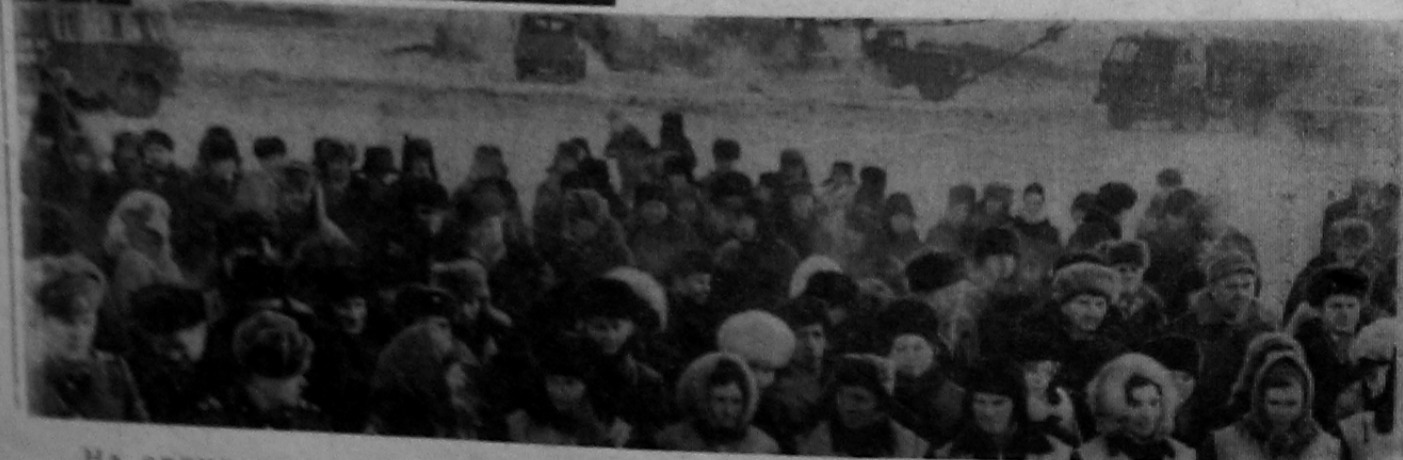
На снимках: начало строительства гиганта цветной металлургии.