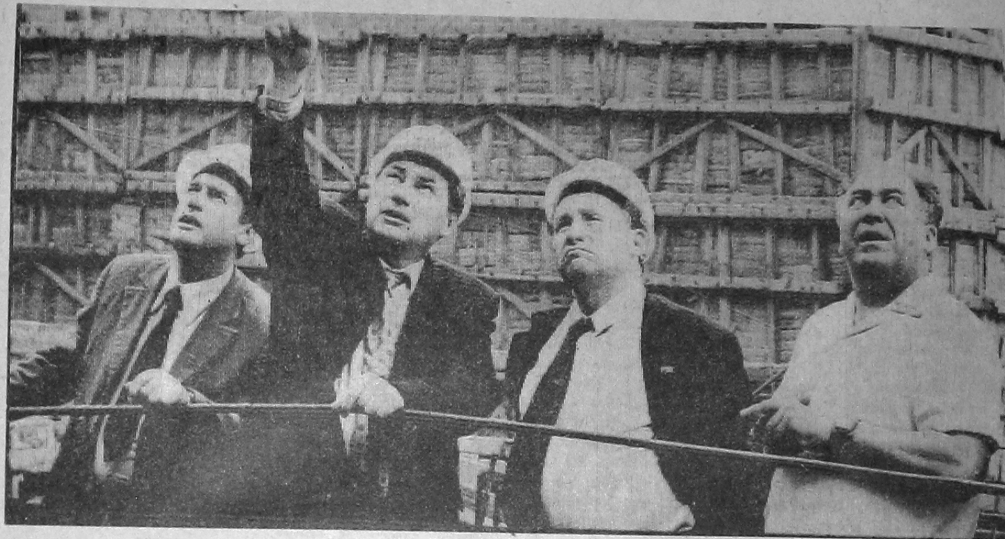
• ШЕФСТВО — ЗАБОТА ОБЩАЯ