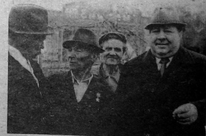
На снимках: празднование Дня Победы в Саяногорске. На нижнем снимке: встретились ветераны былых сражений.