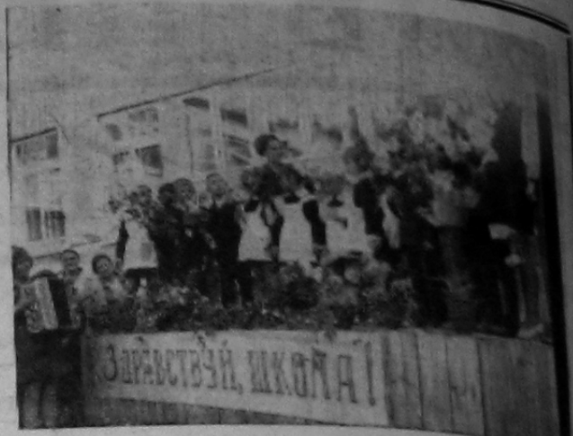
Саяногорцы от всей души желают учителям больших успехов в их благородном труде, детям и юношеству — целеустремленности, упорства в учебе!

Сегодня за партией и те, кто в этом году после учебного года оставит навсегда школьный порог. Дорогие десятиклассники, приобретайте крепкие знания, выбирайте в жизни дорогу своих отцов, умножайте их трудовую славу.