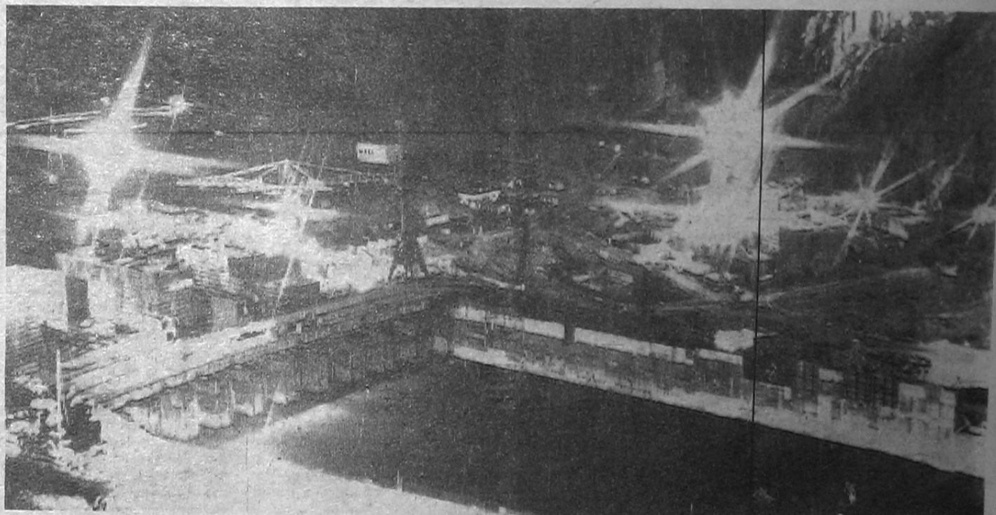
Основные сооружения Саяно-Шушенской ГЭС.