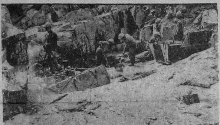
НА СНИМКЕ: левобережный котлован. Идет подготовка основания скальных блоков под бетонирование.