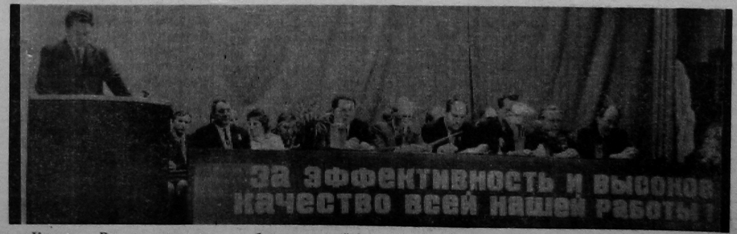
Кинозал «Русь», в президиуме собрания партийно-хозяйственного актива.