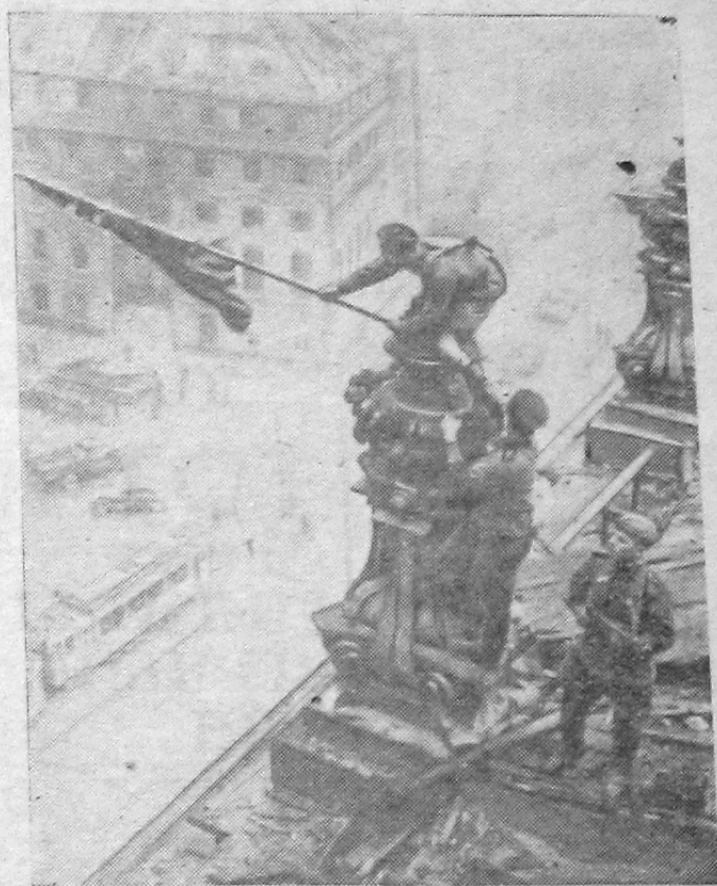
ЗНАМЯ ПОБЕДЫ НАД РЕЙХСТАГОМ.

Сегодня че- ствуют люди планеты всей ветеранов войны, героев мирных дней