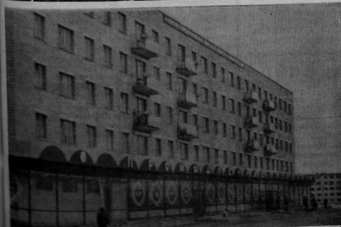
Саяногорск. Новый промышленный магазин.