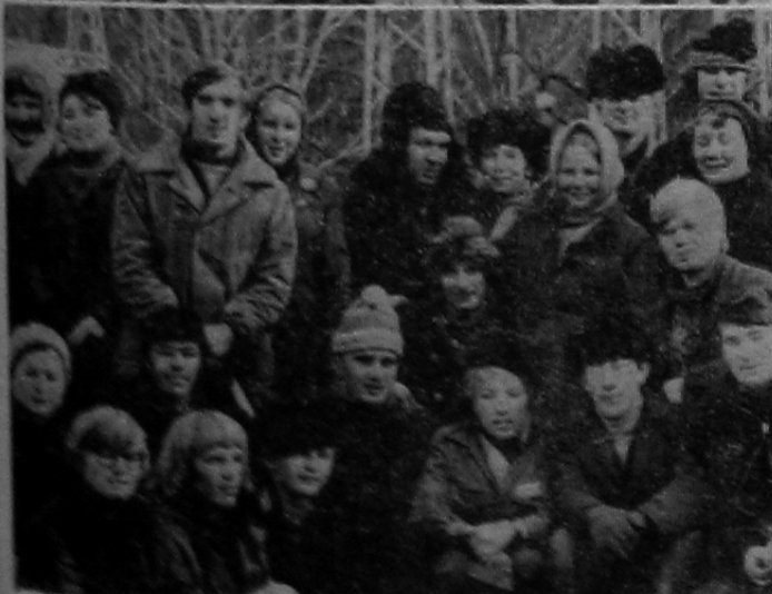
В честь праздника комсомола по-ударному провели субботник на объектах в Черемушках парня и девушки из СМУ-2, УМР, детсада «Колобок», отдела рабочего проектирования.