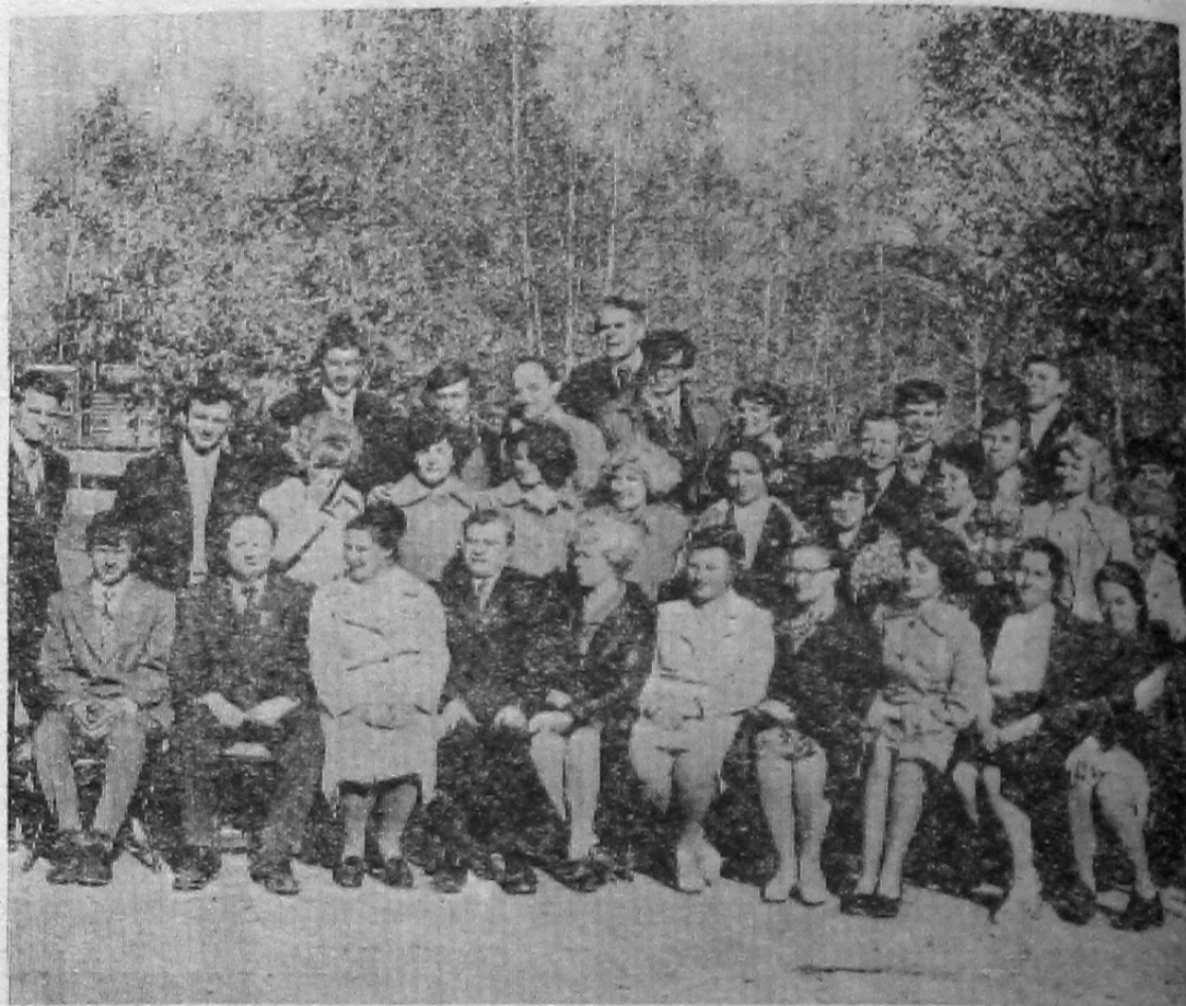
Во время большого исторического события на строительстве Саяно-Шушенской ГЭС — перекрытия Енисея — состоялась встреча комсомольского актива Дивногорска и Саян. Ее участники горячо говорили о своем стремлении умножать славные традиции комсомольцев-гидростроителей.