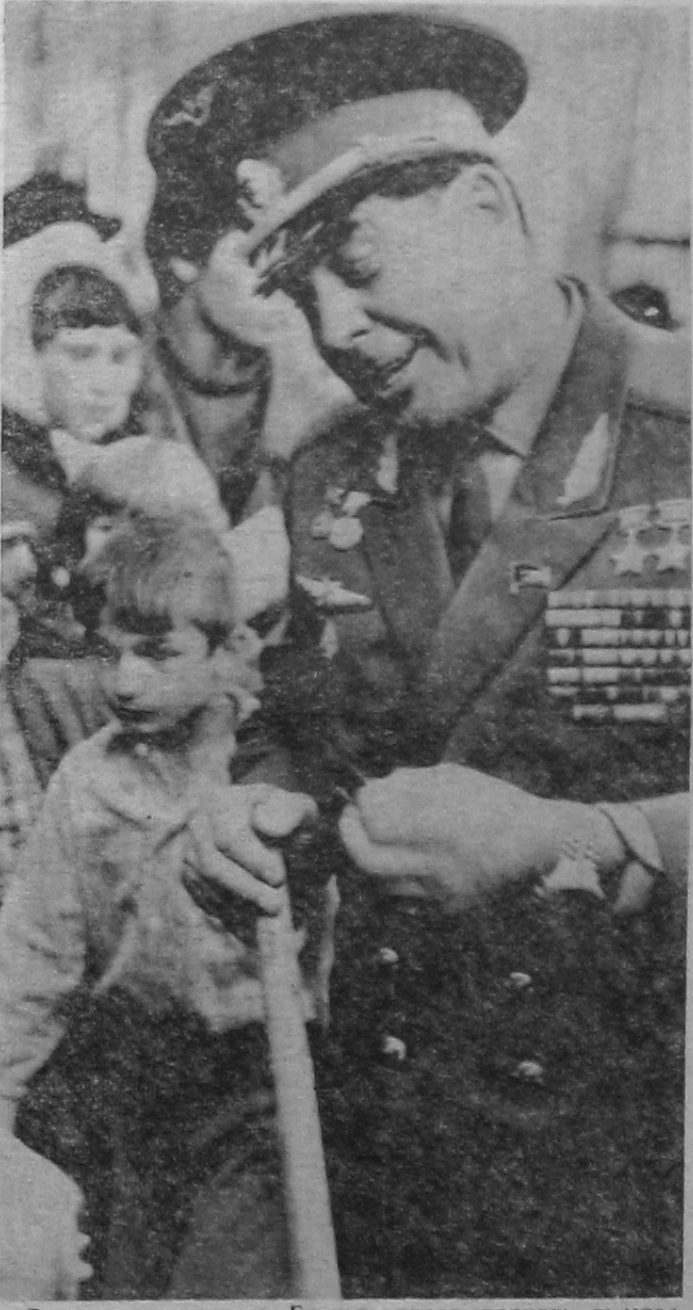
В день перекрытия Енисея: право поднять вымпел «Слава труду!» завоевали лучшие комсомольско-молодежные коллективы; летчик-космонавт дважды Герой Советского Союза Г. Т. БЕРЕГОВОЙ со школьниками во время посадки деревьев в поселке Черемушки.

ПРИНЯТО НА МИТИНГЕ ГИДРОСТРОИТЕЛЕЙ, СОСТОЯВШЕМСЯ 11 ОКТЯБРЯ 1975 ГОДА ПО СЛУЧАЮ ПЕРЕКРЫТИЯ ЕНИСЕЯ.