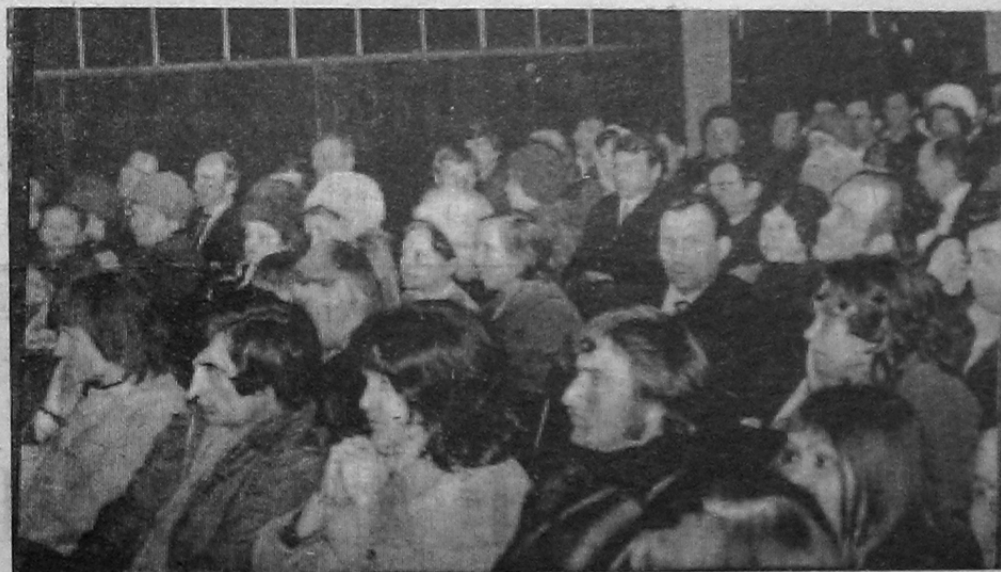
Кинозал «Русь» поселка Черемушки. На слете ударников и передовиков.

Участники слета приняли обращение ко всем строителям Саяно-Шушенской ГЭС.