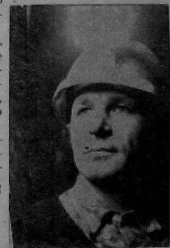
закончить к концу года, а пройти надо еще 500 метров.

Сейчас работники туннельного участка трудятся с большим подъемом. Ведь в 1975 году намечается перекрытие Енисея. Проходку туннеля необходимо