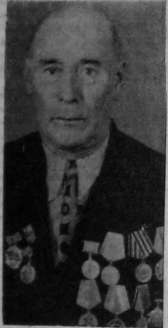
вертел в руке, подал шоферу.

— Вот здесь подрежешь, здесь подгоним, — сказал ему, — и дело пойдет.