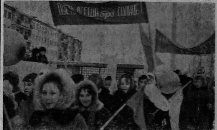
Демонстрация гидростроителей на праздновании Великого Октября.