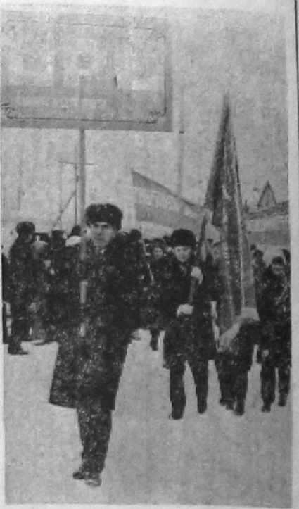
ТЕСНЫМИ КОЛОННАМИ ИДУТ ДЕМОНСТРАНТЫ — ТРУДЯЩИЕСЯ ПОСЕЛКОВ ГИДРОСТРОИТЕЛЕЙ.