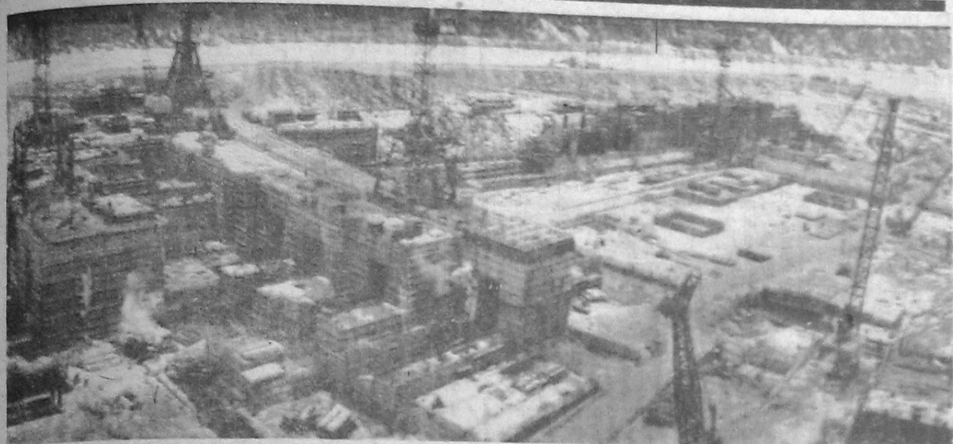
Год издания 6-й