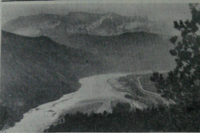
ВИД НА ЕНИСЕЙ С МРАМОРНОГО.