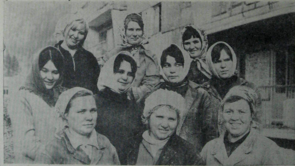
ним трудом отметил кол- лектив День рождения ком- сомолата.

Работать еще лучше, на- стойчиво добиваться новых и новых успехов в труде, учебе и общественной жи- зни — такое стремление пе- редового коллектива.