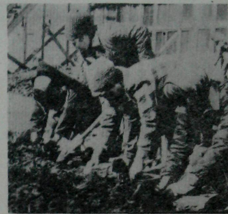
«Красная суббота» 20 апреля 1974 г.