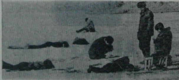
В ВЫХОДНОЙ ДЕНЬ НА ЕНИСЕЕ.

ЖЕЛАЮ ВСЕМ ИМ САМОГО НАИЛУЧШЕГО В БЛАГОРОДНОМ ТРУДЕ ВО ИМЯ САМОГО ДОРОГОГО ДЛЯ ЧЕЛОВЕКА — ЗДОРОВЬЯ. Д. САКУЛИНА.