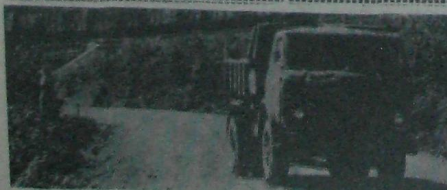
На снимке: до рога идет на строительство Саянской ГЭС.