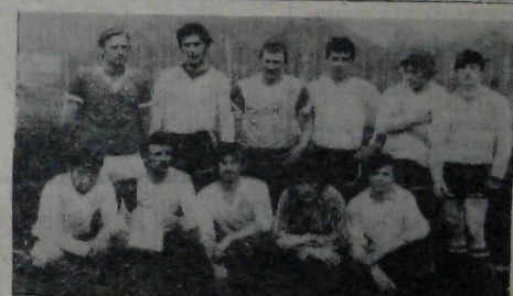
Футбольная команда Сантехмонтажа завоевавшая кубок строительства.

Б. БАРШЕВСКИЙ, начальник рекламного отдела Красноярского зонального управления «Спортлото».