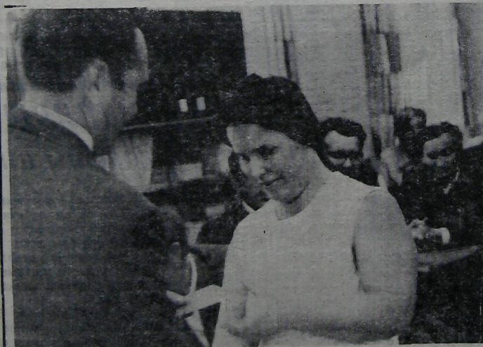
В цеховых парторганизациях строительства Саянской ГЭС продолжается обмен партийных документов.

Сентябрь — завершающий месяц третьего квартала, месяц, который должен быть трудовым показателем высокоурожайным в каждом подразделении. В первую очередь такое требование от коллектива управления основных сооружений — главного фронта Саянской стройки.