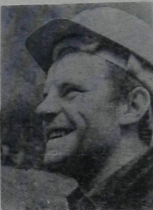
Вчера они были солдатами, а сегодня строят Саянскую ГЭС.