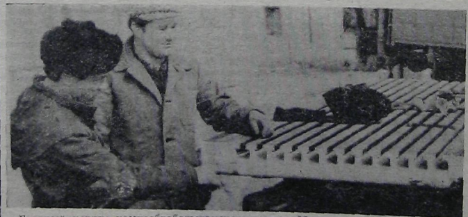
Главный корпус камнеобрабатывающего завода. Монтаж оборудования.