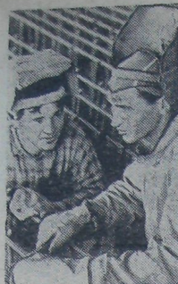
Уский нефтеперерабатывающий завод.

Уже сдан в эксплуатацию арматурный цех. Своей продукцией он снабжает новостройки пятилетки—Марыбскую ГРЭС и Чарджо-