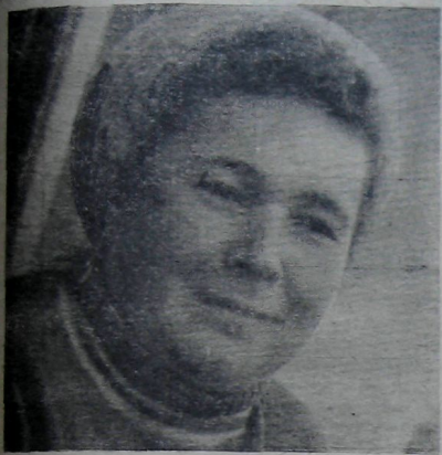
ПЯТИЛЕТКА И МЫ

№ 74 (329) ◆ Суббота, 30 сентября 1972 г. ◆ Цена 1 коп.