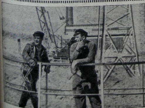
Узбекская ССР. В Голодной степи строится крупнейшая в Средней Азии Сырдарьинская ГРЭС мощностью в 4.400 тысяч киловатт. Гигант энергетики

В почтовых отделениях поселков Означенное, Майна и Черемушки имеются специальные каталоги. Вы сможете ознакомиться в них с периодическими изданиями, выбрать необходимые из них для личного пользования и своей семье.