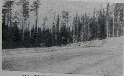
НА ГОРНЫХ СКЛОНАХ ЗИМА.

Мне, как председателю культурно-массовой комиссии при ОПК, довелось участвовать в подготовке и проведении праздника на горнолыжной трассе г. Баштак. Надоело запомнить то ве-