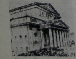
Москва. Вид Большого театра. Здесь в декабре 1922 года проходила I-й Всесоюзный съезд Советов.

предшествовал I Всесоюзному съезду Советов, так же как и съезды Советов УССР, БССР, ЗСФСР. Свидетельство этому — выставленный в Центральном музее В. И. Ленина его последний рукописный документ. Это — конспект речи. Судя по его содержанию, Ленин хотел остановиться в выступлении на вопросах, которые были освещены в его последних статьях, уже не написанных, а продиктованных. К ним относятся записки Ильича «К вопросу о национальностях или об «авто-