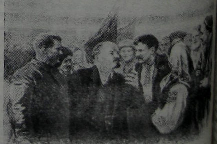
«В. И. Ленин — вдохновитель дружбы народов». Рис. художника Р. Резниченко.

создано на этой земле руками людей, — великие промышленные комплексы и цветущие нивы, каскады электростанций, ценности духовной культуры, — все это результаты общего труда, наше общее достояние советского народа.