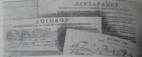
Декларация и Договор об образовании Союза Советских Социалистических Республик, подписанные 30 декабря 1922 года членами полномочных делегаций четырех советских республик.

Огромное внимание В. И. Ленина к вопросам образования Союза ССР можно проследить и по такой детали, как создание государственного герба. В одном из первых проектов эмблемы для государственной печати молодой советской республики переключившиеся серп и молот как бы проныривались мечом. Этот проект вызвал замечание Ленина. Сохранилась пометка Ильича на одном из документов: «Выкинуть из рисунка меч». Сейчас каждая из 15