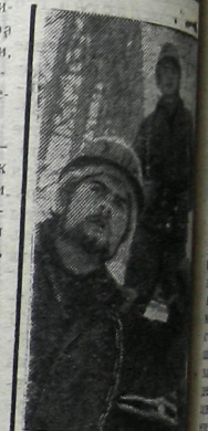
Набережные Челны (Татарская АССР).

От точности, достоверности фактов, данных в немалой степени зависит авторитет газеты, сила воспитательного действия ее выступлений, эффективность печатного слова.