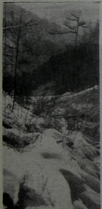
САЯНЫ ЗИМНИЕ.