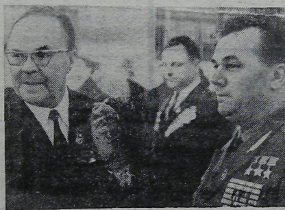
МОСКВА. XXIV съезд КПСС. На снимке: на переднем плане — народный художник СССР Н. В. Томский и трижды Герой Советского Союза Н. Н. Кожедуб в перерыве между заседаниями.