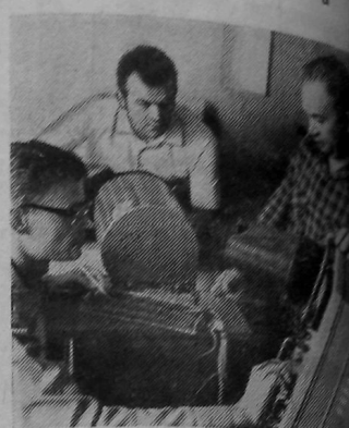
Ташкент. Автоматическое устройство обработки ленточных диаграмм создано в лаборатории телемеханики узбекского научно-исследовательского института энергетических машин.

В диаграммах на многих предприятиях непрерывно фиксируется расход энергии, воды, давление в котлах и многие другие показатели технологического процесса. Они служат главным документом при оценке оборудования и при финансовых расчетах. Обработку ленточных диаграмм, выполняемую до сих пор вручную, «доверить» аппарату, внедрение которого даст народному хозяйству большой экономический эффект.