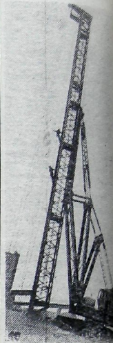
Оренбургская область. На Орском заводе строительных машин создан опытный образец копра для забивки свай длиной до 20 метров и весом до 12 тонн. Агрегат разработан Ленинградским центральным конструкторским бюро «Строумаш» совместно с конструкторами завода. Он будет применяться при сооружении плотин, портовых сооружений зданий. На снимке: монтажники заканчивают сборку копра.