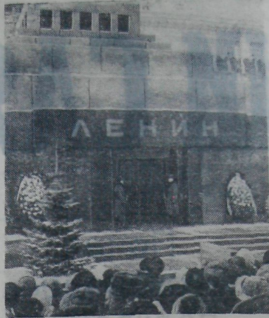
МОСКВА. ЯНВАРЬ 1971 ГОДА. У МАВЗОЛЕЯ В. И. ЛЕНИНА.