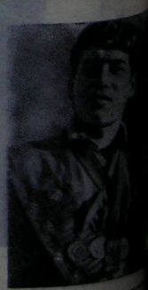
Редактор В. КОРНИЛОВ

Продолжается подписка на газету «Огни Саян»