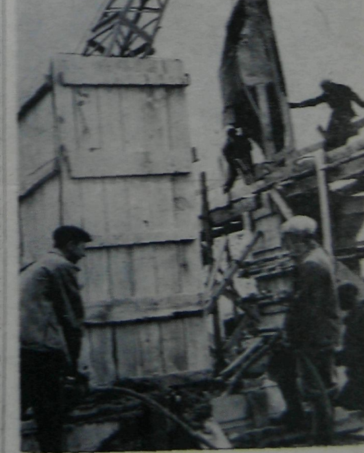
НА СНИМКЕ: Бетон идет в фундамент.

Лента новой дороги вместе с ней приближается к месту назначения — Майне.