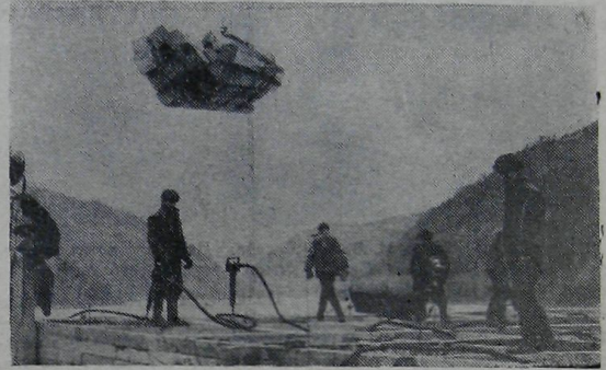
Растет ряжевый оголовок.

Товарищи строители! Своевременно завершим подготовительные работы для пропускания паводковых вод.