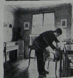
НА СНИМКЕ: Музей-квартира В. И. Ленина в Париже по улице Мари-Роз, дом 4. Здесь Владимир Ильич жил с 1909 по 1912 год.

Лонжюмо под Парижем Ленин создал специальную партийную школу и в течение четырех месяцев занятий прочел здесь цикл лекций (29 лекций по политической экономии, 12 — по аграрному вопросу, 12 — по теории и практике социализма в России, три лекции о материалистическом понимании истории и реферат о текущем моменте и положении дел в партии). В школе обучалось 18 рабочих, прибывших из Петербурга, Москвы, Николаева, Сорбурга, Баку, Тифлиса и других городов. Потом все слушатели школы были направлены в Россию на подпольную работу.