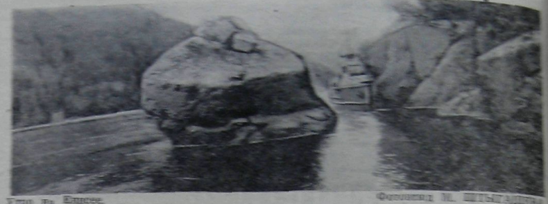
Гора на Енисее.

а добил. Мно не зовен Не сплитися на сонноу И все лепри В ступи в вазонный Вернувшись кинит И сурдостью движется А звезда адут до Абисиния. Был жаль, что скоро Была бы адут С ступой, заплываю звезд Ты мне привнеси руку А в ней блеснет Б. РЫЛЬЦОВ, студент ГРТИ.