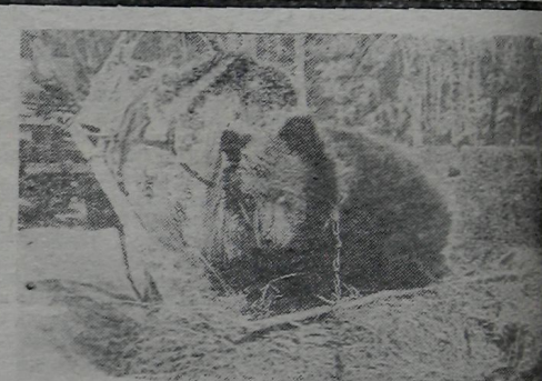
Генерал Топтыгин в плену.

Пишите стих, пишите, пишите! И чувства удачей своей всполошите. Пусть жизни откроется вам глубина Счастливой и мудрою верой полна. По утренним росам примните туман. Цветы соберите любимым, друзьям. Под вечер на улицы песню несите. Пишите стихи, пишите. Пишите.