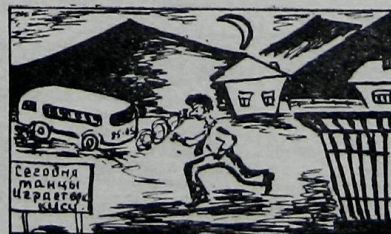
Опоздал с танцев, получил наряд на кухне.